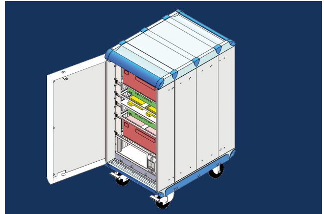
3 D-Zeichnung des HeiCase auf Rollen mit Innenausbau bei geöffneter Fronttür