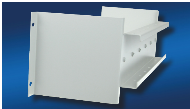
Baugruppenträger HeiPac DIN Rail ECO mit pulverbeschichteter Oberfläche (RAL 7035)