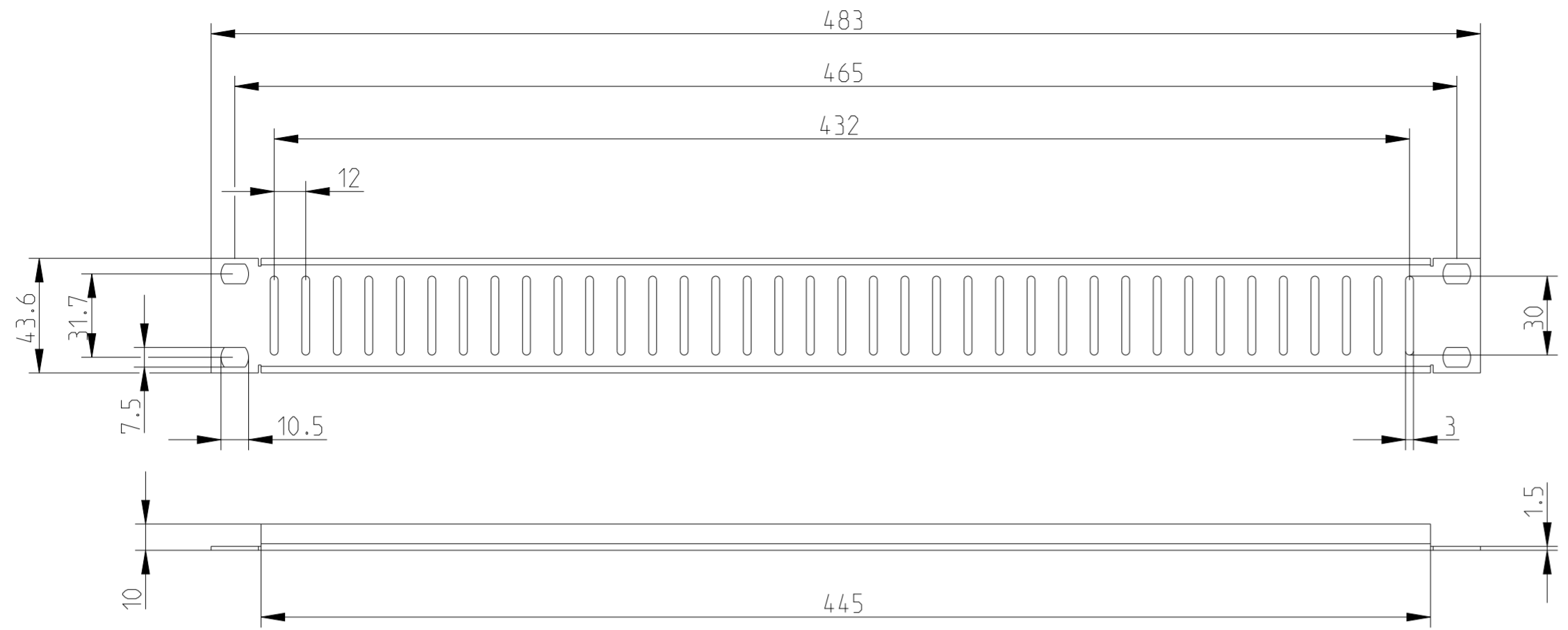
1HE Artikel / part: 9926851